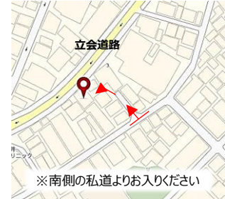
※南側の私道よりお入りください