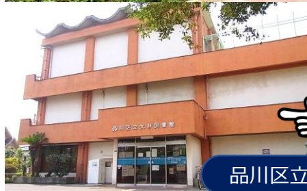
品川区立大井図書館